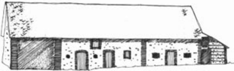
Bâtiment agricole de structure mixte brique et silex.