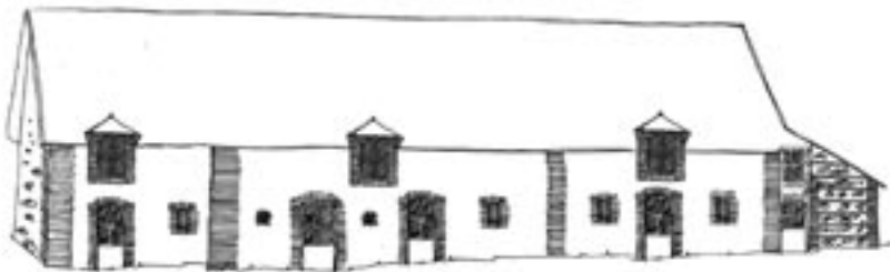
Transformation en habitation nécessitant la création d'ouvertures tout en respectant le savoir-faire employé sur le bâtiment d'origine.