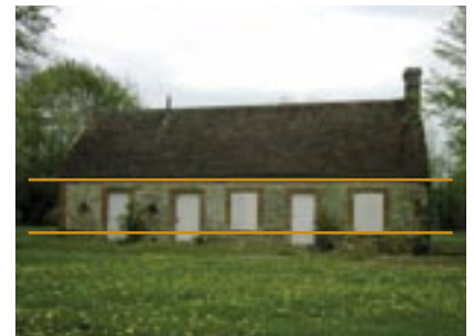
Maison rurale : alignement des linteaux et des appuis