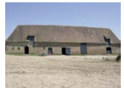
Bâtiment agricole : absence de symétrie en façade, dominance des pleins sur les vides

Restauration de la grange pour un changement de destination en logement. La structure en pan de bois s'adapte pour recevoir de nouvelles grandes ouvertures. Les portes d'accès aux granges sont transformées en grandes baies vitrées.