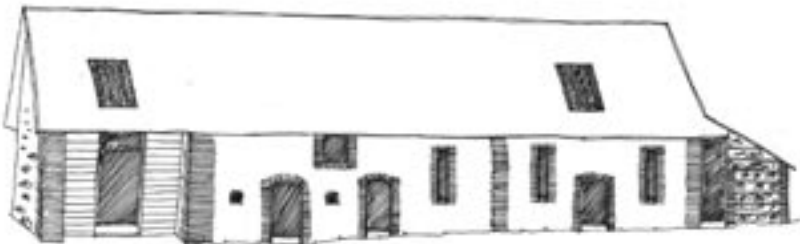
Transformation en habitation qui s'adapte à des formes architecturales contemporaines et des nouveaux modes de vie (recherche de la lumière, meilleure isolation ...) tout en respectant le bâtiment d'origine.