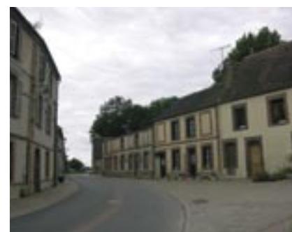
Maison de bourg