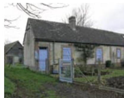
Maison élémentaire ou manouvrière